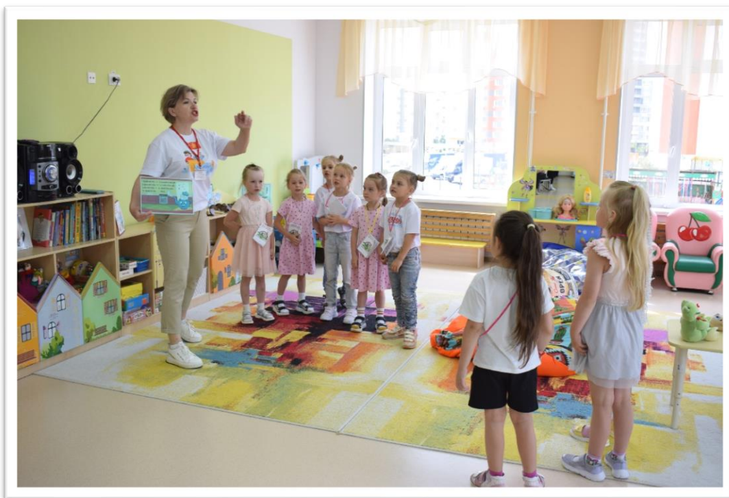
Фото 7. Сочиняем рэп в мастерской «Мир музыки».

Материал и оборудование: музыкальные инструменты, костюмы, атрибуты игровых образов, разные виды театров, атрибуты для творчества: цветы, платочки, ленты, предметы искусства и др.