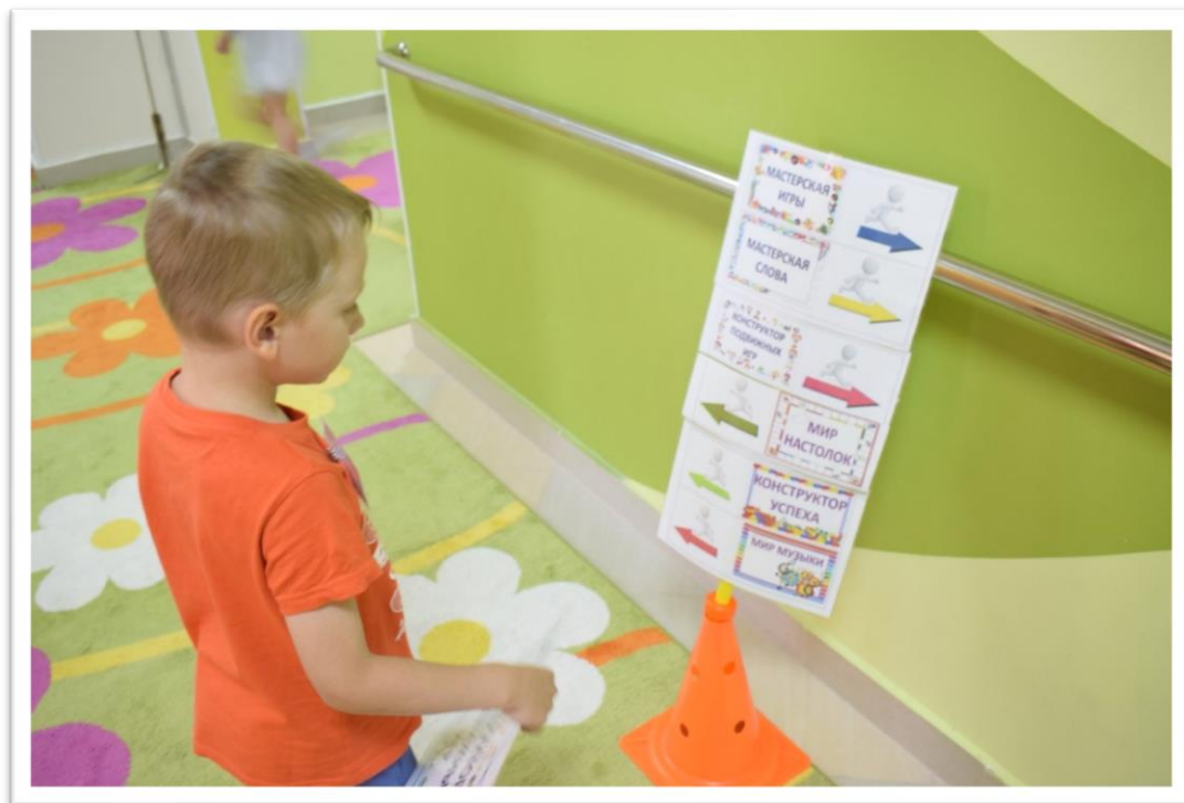
Фото 1. Навигатор в коридоре.

Игровой клуб проводится на 2 этаже детского сада, где размещаются старшие и подготовительные группы, всего на этаже 6 групп, поэтому организуется 6 мастерских. На период проведения для безопасности детей, межэтажные двери закрываются. Открываются все групповые двери, на которых размещается навигация: где? какая мастерская будет проходить. Перед входом в групповое помещение, для занятий в мастерских дети надевают на руку цветной браслет, после выхода снимают его. Это делается для того, чтобы ограничить количество детей в мастерской, для успешной детской деятельности. Если ребенку не хватило браслета, а ему хочется именно в эту мастерскую, он может в это время пойти в другую мастерскую, где есть браслеты, а сюда вернуться через 20 минут, когда дети закончат и начнется следующее занятие.