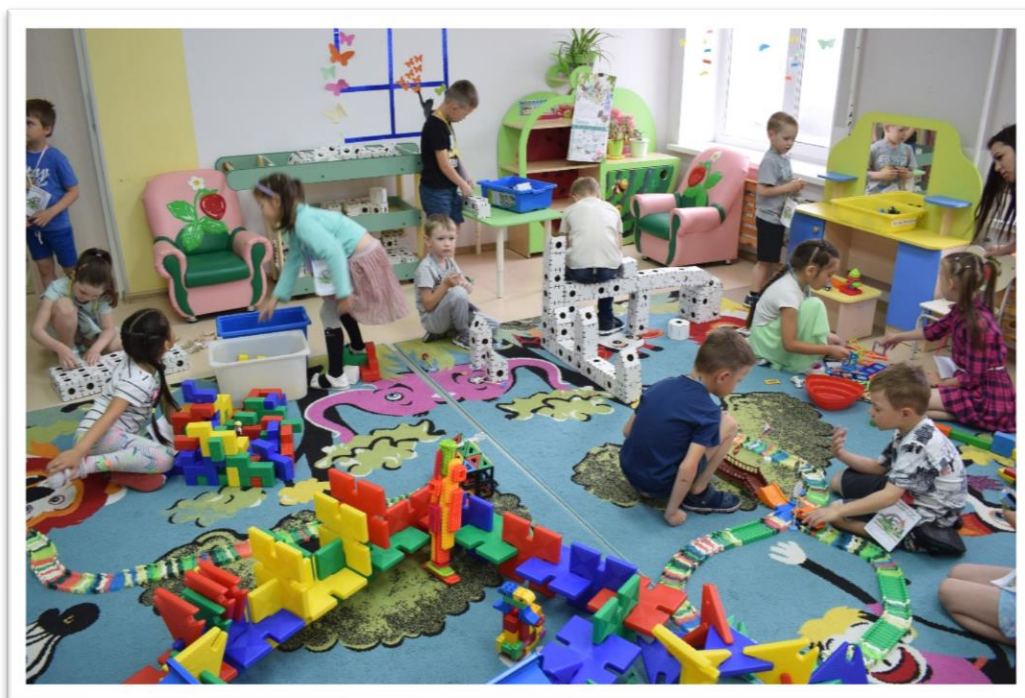
Фото 8. Свободная игра в «Конструкторе успеха».

Материалы: схемы, рисунки, фотографии зданий разного назначения, фотографии достопримечательностей родного города, фотографии столицы нашей Родины – Москвы и др.