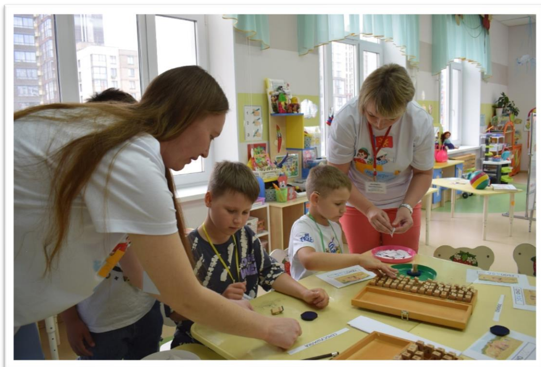
Фото 4. Работа с детской типографией в «мастерской слова».

Результат: новые слова, произведения собственного сочинения, издание книг.