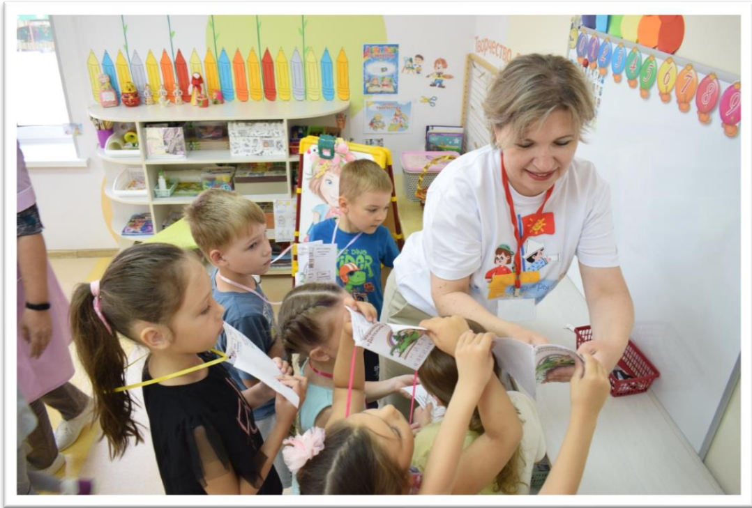
Фото2. В конце занятия ребенок получает наклейку.