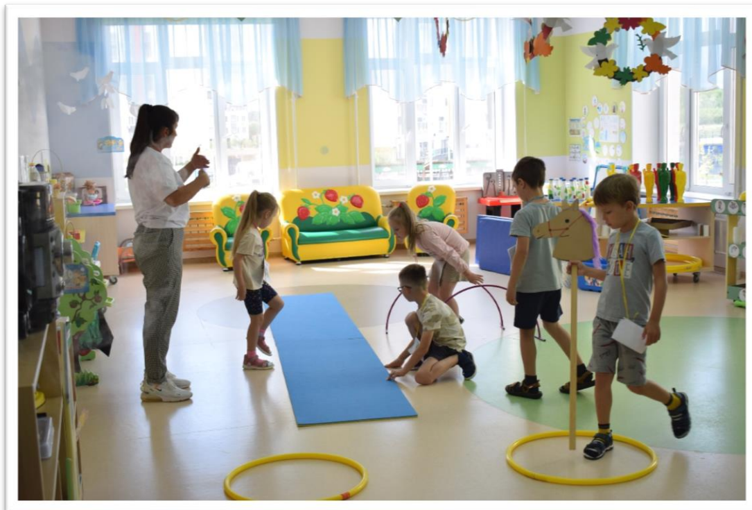
Фото 5. Придумываем новую игру в «Конструкторе подвижных игр».

Материалы и атрибуты: лист ватмана для фиксации игры, цветные маркеры, фломастеры, спортивное оборудование (обручи, мячи, скакалки, кегли, гимнастические палки, массажные коврики, скамейки и др), спасательные круги, мягкие модули, детские стульчики, «арт-хлам» (пластиковые бутылки, картонные коробки, старые обои, шторы и др).