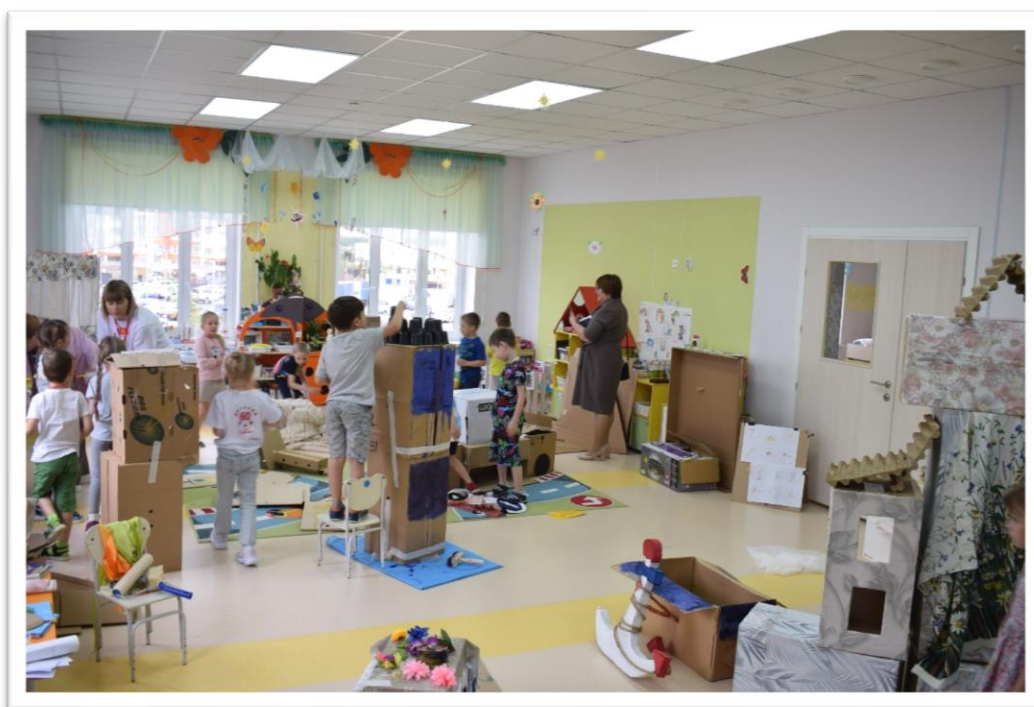
Фото 3. Деятельность детей в «мастерской игры».

Материал: «арт-хлам» (картонные коробки, старые обои, шторы, строительный и малярный скотч, полиэтиленовые пакеты, крышечки, лоскуты ткани, оберточная бумага, природный материал и многое др.), материалы для творчества (малярные кисти, валики, акриловые краски, малярные ванночки, клей, ножницы и др.)